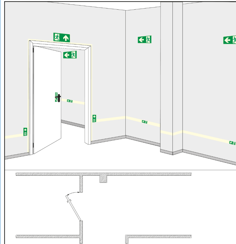
Abb. 1: Beispiel für Anordnung von Komponenten eines langnacheuchtenden optischen Sicherheitsleitsystems und hochmontierter langnacheuchtender Sicherheitszeichen (räumliche Darstellung und Grundriss)

(3) Der Arbeitgeber hat die Sicherheitsbeleuchtung und die Sicherheitsleitsysteme in regelmäßigen Abständen sachgerecht warten und auf ihre Funktionsfähigkeit prüfen zu lassen. Die Prüffristen ergeben sich aus der Gefährdungsbeurteilung unter Berücksichtigung der Herstellerangaben. Festgestellte Mängel sind umgehend sachgerecht zu beseitigen.